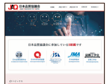
図・2 JAQホームページ

・URL: https://jsqc.org/jaq/ ※PC、スマートフォンで閲覧可能